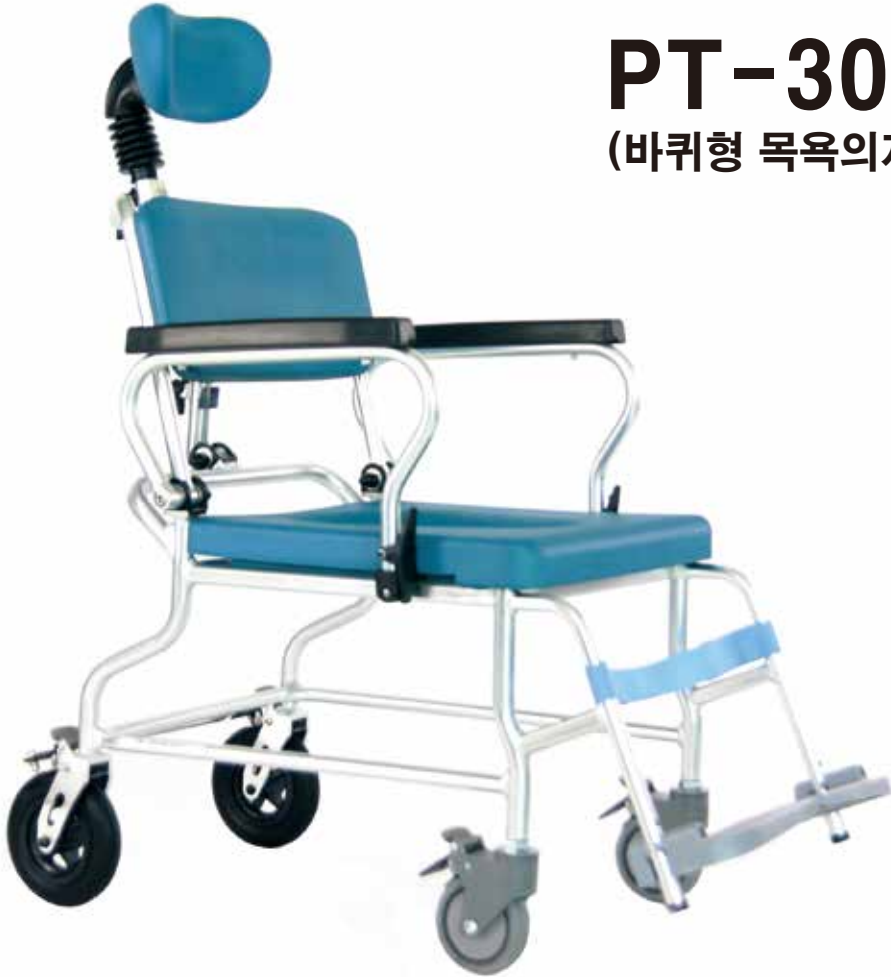
PT-300 (바퀴형 목욕의자)

※ 본 사용설명서는 고객여러분의 편의와 안전을 위하여 반드시 읽어보시고 내용을 숙지하신 후 사용하시기 바랍니다.